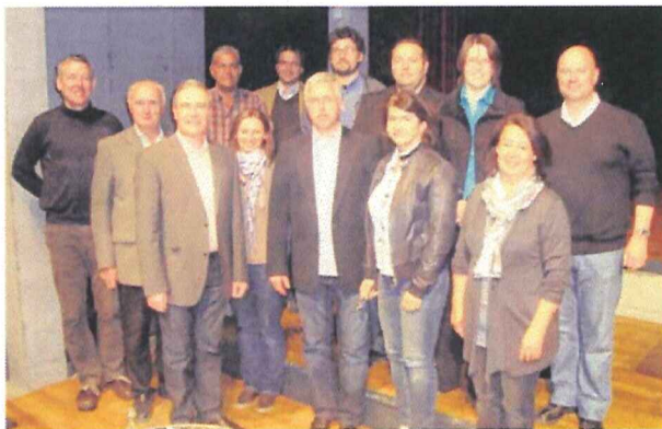
Der neue Vorstand samt den Beiräten des Geschichtsvereins Region Bludenz.

die als Vertreter für die Regionen Tannberg (Lech) und Walgau (Schlins) den Wirkungskreis des Vereins noch einmal erheblich erweitern werden. SS