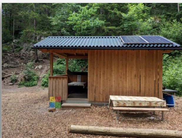
Abbildung 4: Lagerhütte von der Seite