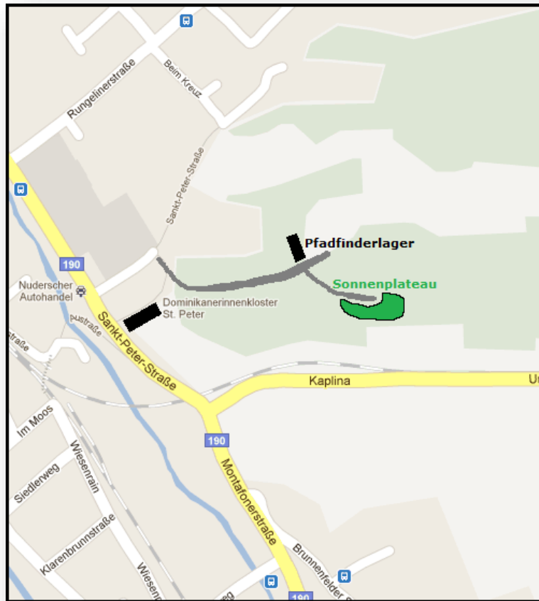
Abbildung 1: Lageplan Waldkindergarten

Der Waldkindergarten befindet sich oberhalb des Klosters St. Peter und ist im Pfadfinderlager St. Agnes untergebracht. Dazugehörig ist die Fläche des Sonnenplateaus. Erreichbar ist er durch eine Forststraße, die hinter dem Kloster in den Wald führt.