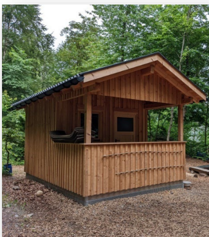
Abbildung 3: Lagerhütte von vorne

Auf dem Dach befindet sich eine Photovoltaikanlage. Somit haben wir Strom beim Sonnenplatz für heißes Wasser (Tee kochen), Licht, Verwendung von Heißkleber usw.