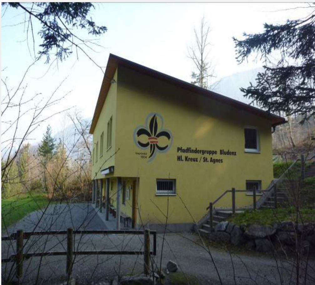
Abbildung 6: Pfadfinderheim

Auch die Wiesenanlage außerhalb des Pfadfinderheimes kann im Winter als Rodelstrecke, zum Schnee Schaufeln und Bauen, verwendet werden