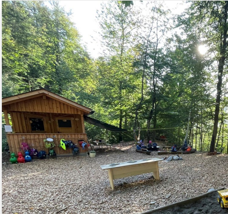
Abbildung 2: Waldplatz

Seit 2021 haben wir eine neue Lagerhütte für Spiel und Bastelmaterial, Werkzeug mit überdachtem Kreativtisch.