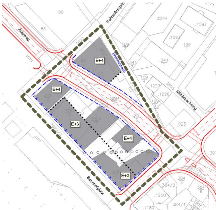
Eine Studie der Stadtplanung zeigt eine mögliche Gebäudeanordnung nach den Bestimmungen des neuen Teilbebauungsplanes.