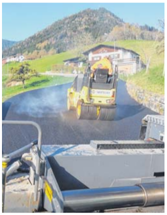
1,5 Kilometer lange Straße wurde neu asphaltiert.

FRASTANZ. Die Sanierung des Amerlögnerweges ist so gut wie abgeschlossen. Auf der 1,5 Kilometer langen Verbindungsstraße zwischen Frastanz und der Amerlügen wurde der Belag komplett erneuert, punktuell wurde die Straße auch verbreitert. Derzeit passen die Arbeiter Bankette und Leitschienen an. Die Kosten belaufen sich auf 450.000 Euro. Weitere 300.000 Euro investiert die Marktgemeinde in die Abwasserbeseitigung im Rungeltonweg. Sechs Wohnhäuser werden ans Netz angeschlossen. Mitte Mai sollen die Arbeiten erledigt sein.