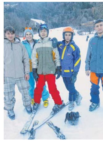
Sorglose Momente am Golm für 13 junge Asylwerber.