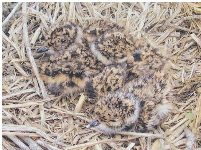
Ein Schatz der Natur: Frisch geschlüpfte Kiebitze in ihrem Nest. Im Ried ist ihre Überlebenschance groß.