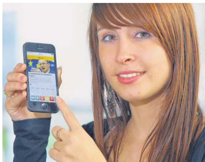
Die preisgekrönte App von VOL.AT spielt alle Stücke.

Download der App für iOS und Android unter app.vol.at