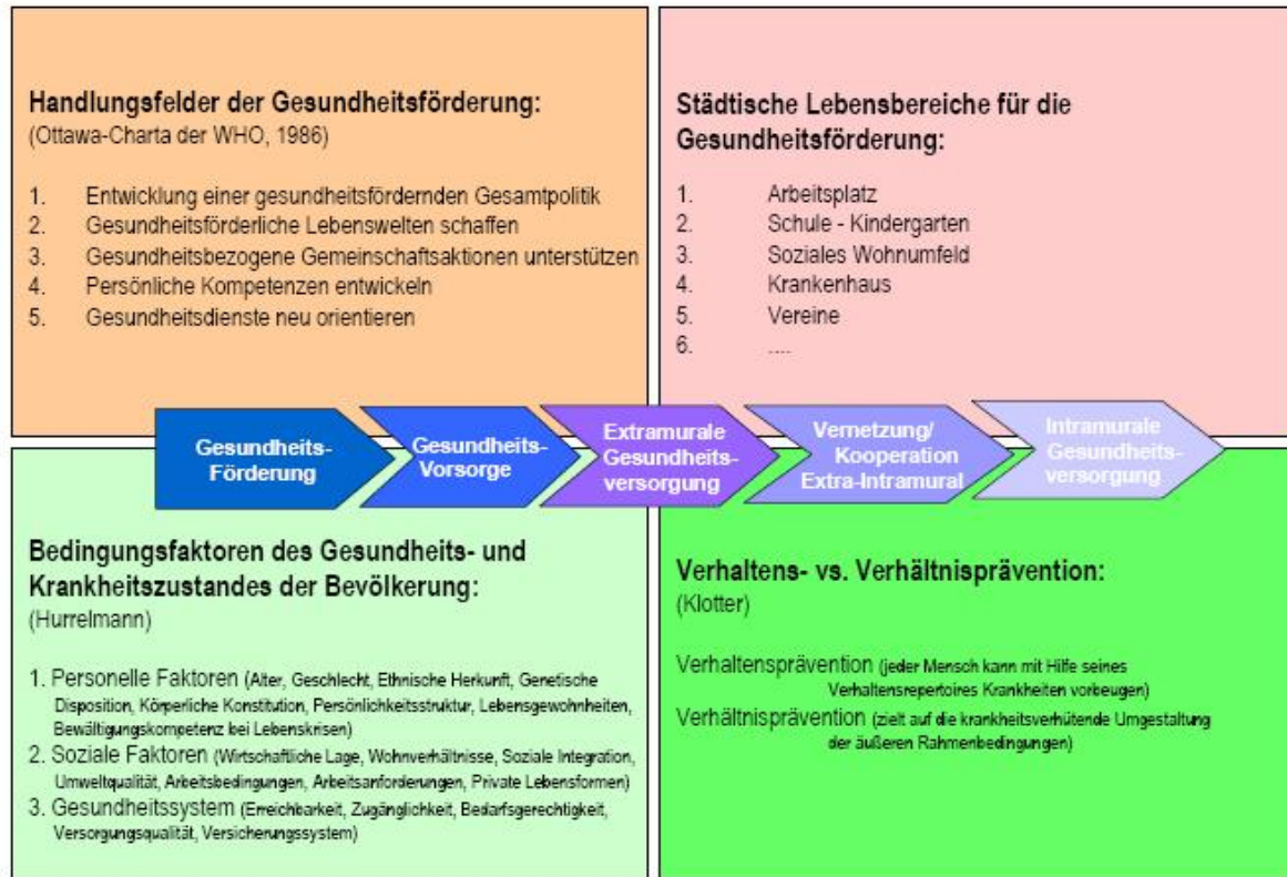
Abbildung: Ansatzpunkte für das städtische Gesundheitskonzept